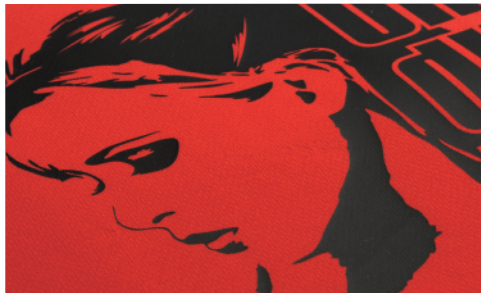
※メートル単価 A3換算 ¥250～