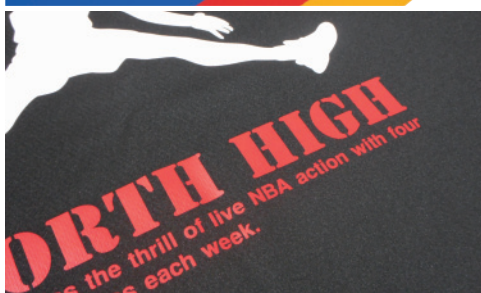
※メートル単価 A3換算 ¥246～