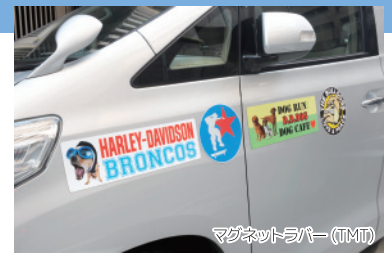
マグネットラバー (TMT)