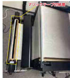
②テフロンシート (MT) の終点とマジックテープ付紙管を貼り合わせます。