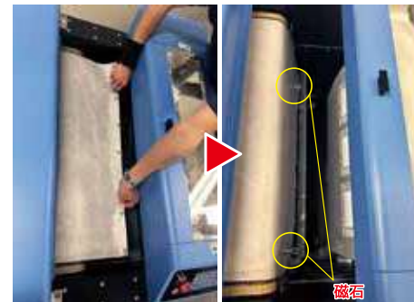
③テフロンシート (MT) の始点を所定の位置で磁石で固定します。