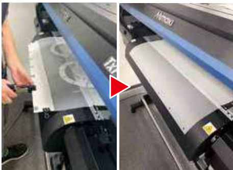
①フィルムの始点にテフロンシート (MT) と接続する為の穴を開けます。フィルムに専用治具を乗せてクリップで固定しパンチで穴を開けます。

フィルムにパウダーが載る箇所から紙管までを DTF 用テフロンシート (MT) (※シェーカー用補助シート) で補います。フィルムの始点を紙管にセットして印刷を開始する場合と比べてフィルムのロスを大幅に削減頂けます。